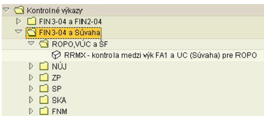
Obr. 1 – kontrolné výkazy

Pre potreby porovnania väzieb príslušných riadkov medzi výkazmi FIN 3-04 a súvahami boli vytvorené tzv. medzivýkazové kontroly, ktorými je možné sledovanie korektnosti odovzdávaných výkazov pre jednotlivé typy klientov (obr.1). Tieto výkazy je možné nájsť v užívateľskom menu: „Výkazy Štátnej pokladnice – produktívny systém“ → „Kontrolné výkazy“ → „FIN3-04 a Súvaha“.