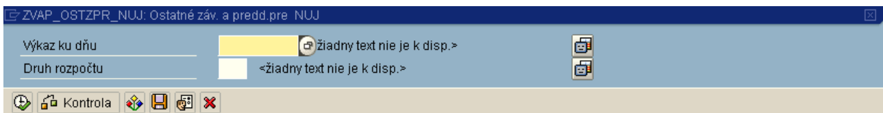
Obr. 6 – základné výberové kritériá 1

Po kliknutí na "Ano" sa zobrazí ďalšie dialógové okno (obr.6), kde je potrebné vyplniť dátum, ku ktorému chceme kontrolovanie vykonať a ak je potrebné, tak aj druh rozpočtu kontrolovaného klienta.